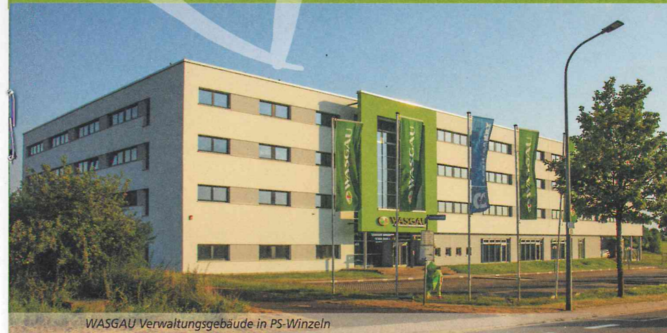
WASGAU Verwaltungsgebäude in PS-Winzeln