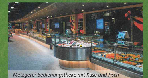
Metzgerei-Bedienungstheke mit Käse und Fisch