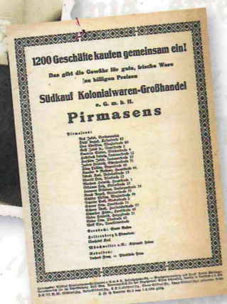
Kolonialwarenladen Grill Ecke Horeb-/Vogelstraße