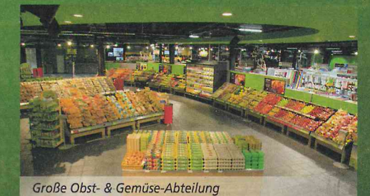
Große Obst- & Gemüse-Abteilung